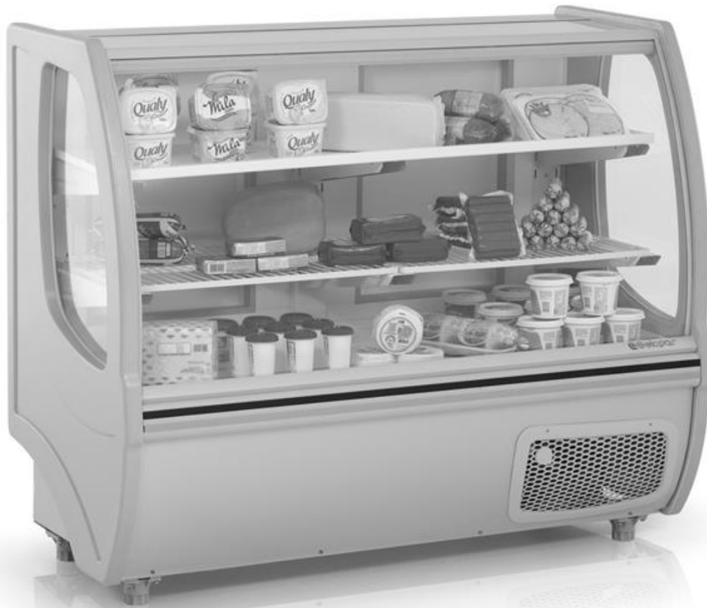
Imagem meramente ilustrativa GBUP-140

Balcão Frigorífico universal "sirius" vidro curvo uma Placa Fria • 0,75m – 1,10m – 1,40m – 1,75m – 2,05m