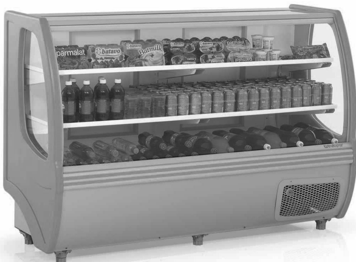
Imagem meramente ilustrativa GBDF-205T

Balcão Frigorífico Universal “Fênix” Vidro Curvo Duas Placas Frias • 1,07m – 1,40m – 1,72m – 2,06m